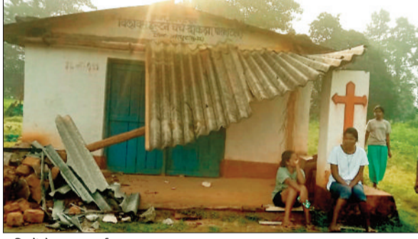
हाथियों ने ढहाया चर्च।

हाथियों का आतंक अब जशपुर जिले के लोगों के लिए रोजमर्रा की समस्या बन गया है। कभी खेत उजाड़ना, कभी घर तोड़ना तो कभी धार्मिक स्थलों को नुकसान पहुंचाना ऐसा कोई दिन नहीं गुजरता जब हाथियों का उत्पात जिले में न दिखे। बीती रात कांसाबेल विकासखंड के दोकड़ा गांव में हाथियों ने बिलिक्रस ईस्टर्न में शेष पेज 4 पर