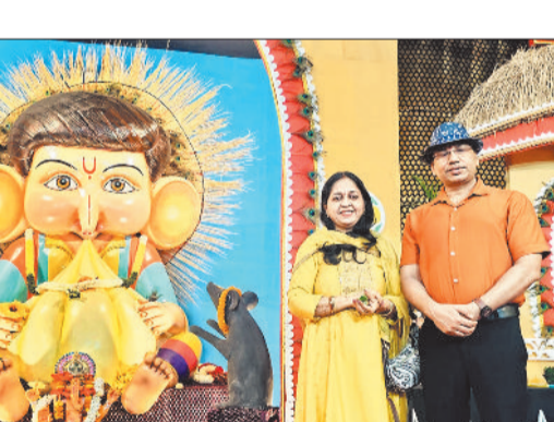
धर्मपत्नी के साथ गणेशजी का दर्शन करते एसएसपी।

गणेशोत्सव केवल धार्मिक आयोजन ही नहीं: सिंह-पंडाल भ्रमण के दौरान वरिष्ठ पुलिस अधीक्षक ने कहा कि गणेश उत्सव केवल धार्मिक