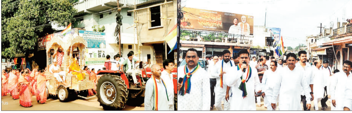
रथ पर सवार मुनिसुव्रतनाथ।

दश लक्षण महापर्व के दसवें एवं अन्तिम दिन शनिवार को जैन समाज ने अनन्त चतुर्दशी के अवसर पर नगर में ऐतिहासिक और भव्य शोभायात्रा का आयोजन किया। दोपहर तीन बजे जैसे ही भगवान को आकर्षक सजा-धजे रजत रथ में विराजमान कराया गया, मंदिर प्रांगण से लेकर नगर के प्रमुख मार्गों तक श्रद्धालुओं की भीड़ उमड़ पड़ी। वातावरण पूरी तरह धार्मिक आस्था और भक्ति भाव से सराबोर हो उठा।