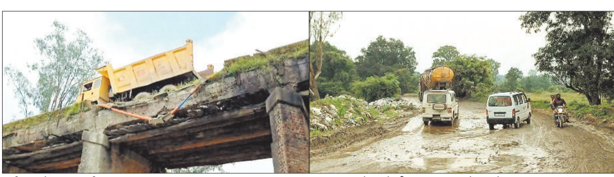
जर्जर पुल से गुजरता हाईवे।