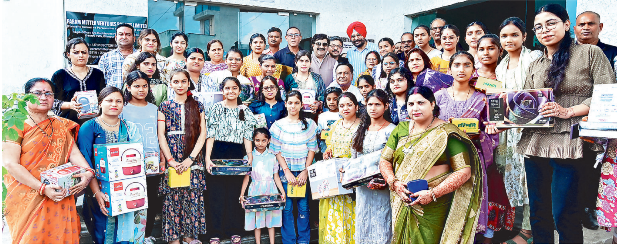
हरिभूमि की रंगोली, मेहंदी व सामान्य ज्ञान प्रतियोगिता के पुरस्कार वितरित