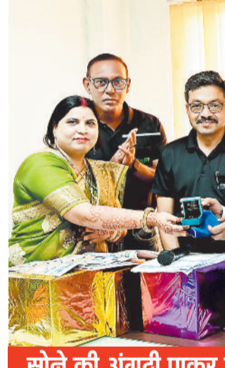
सोने की अंगूठी पाकर खिला चेहरा